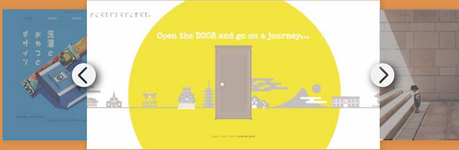
HPデザイン課題 使用ソフト:Illustrator, Photoshop, VisualStudioCode © 2020 マーケティングデザイナー科 第23期生 生徒作品