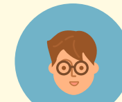
WEBマーケティングデザイナー養成科 修了生 Aさん