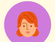
マーケティングデザイナー科 修了生 Bさん

A. パソコンに不慣れだったことです。でも、入校後は授業中もすぐに質問できて、置いて行かれることはありませんでした！