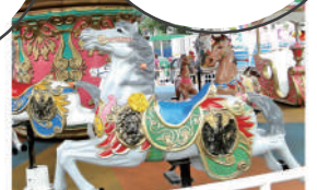
写真サイズ: 8cm×8cm 解像度350px キャンバスサイズ: 9cm×10cm