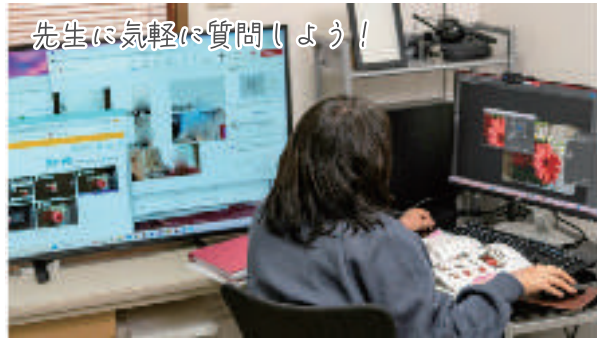
先生に気軽に質問しよう!