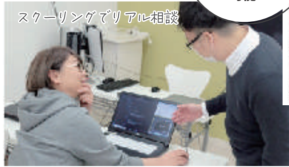
スクーリングでリアル相談